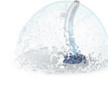
Attraktion: SILHOUETTE N°1