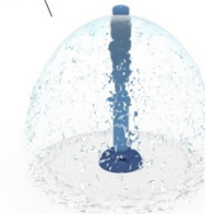
Attraktion: SILHOUETTE N°1