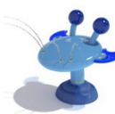
Attraktion: CRAB N°1